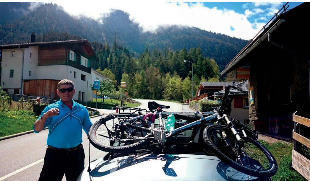
Liften met fiets